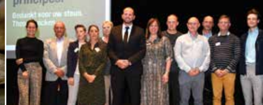
Theo Francken op bezoek (p. 3)