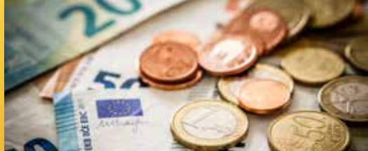
Ruim twee miljoen euro extra voor Staden (p. 2)